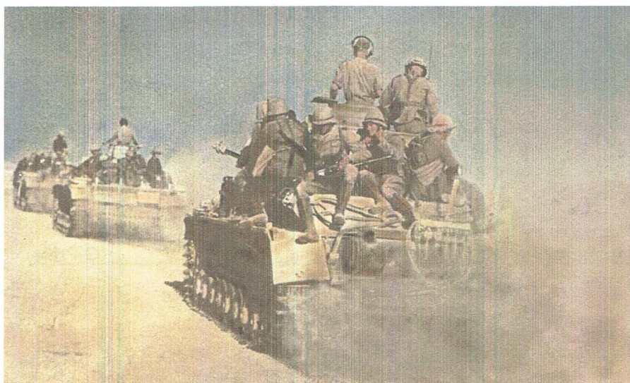
Deutsche Panzerinheit in Nordafrika 1942: »Die Wehrmacht war nicht lernfähig«